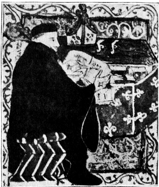
На этой иллюстрации XII века изображен настоятель Сент-Олбанского монастыря Симон, читающий перед открытым ларем: в Средние века книги часто хранили в таких ларях

найти нужную, но вполне возможно, что книги просто хранились в таком положении: именно передний край, а не корешок мог что-то сообщить о содержании тома.