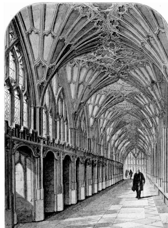
В галерее Глостерского собора есть длинный ряд ниш, которые наверняка превращались в великолепные кабинки для чтения

В умеренном климате кабинки в западноевропейских монастырях были, вероятно, уютными (а то и навевающими сон) уголками, но на холоде читать в них было не очень то удобно. Писцы довольно часто «жаловались на то, что им трудно работать холодной северной зимой» 65 . Кроме того, писцы сидели лицом к внутреннему двору и галерее,