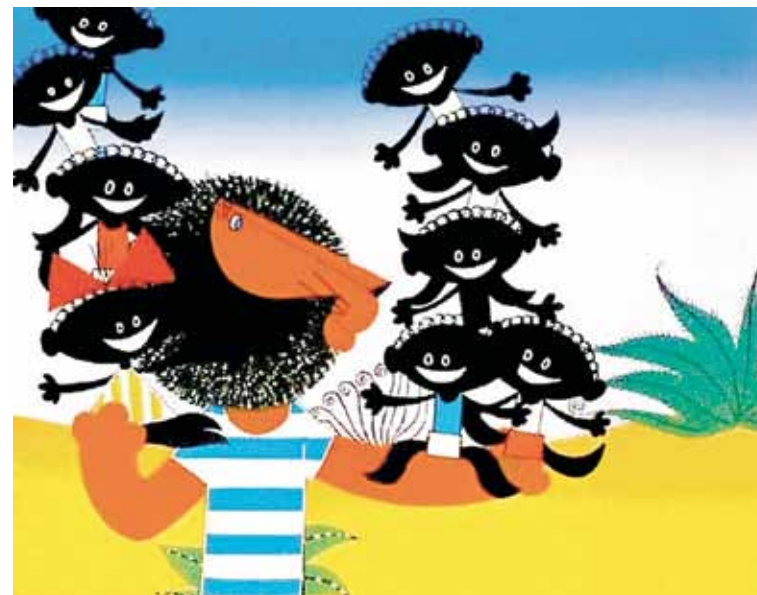
Каникулы Бонифация. 1965

Любопытно, что наличие негров в игровом кино никак не отразилось на мультипликации, где традиции Дюрера живы до сих пор.