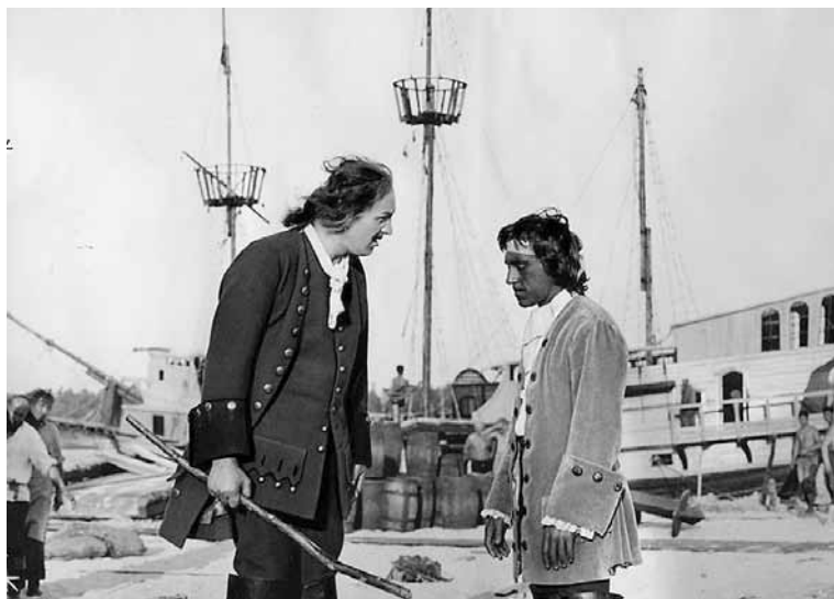
Сказ про то, как царь Петр арапа женил. 1976. В роли негра — Владимир Высоцкий

Потом что-то изменилось. Негры кончились. Вплоть до 1990-х в роли негров выступали нагугалиненные русские.