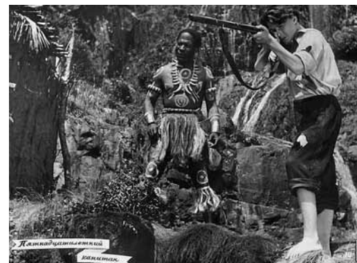
Пятнадцатилетний капитан. 1945