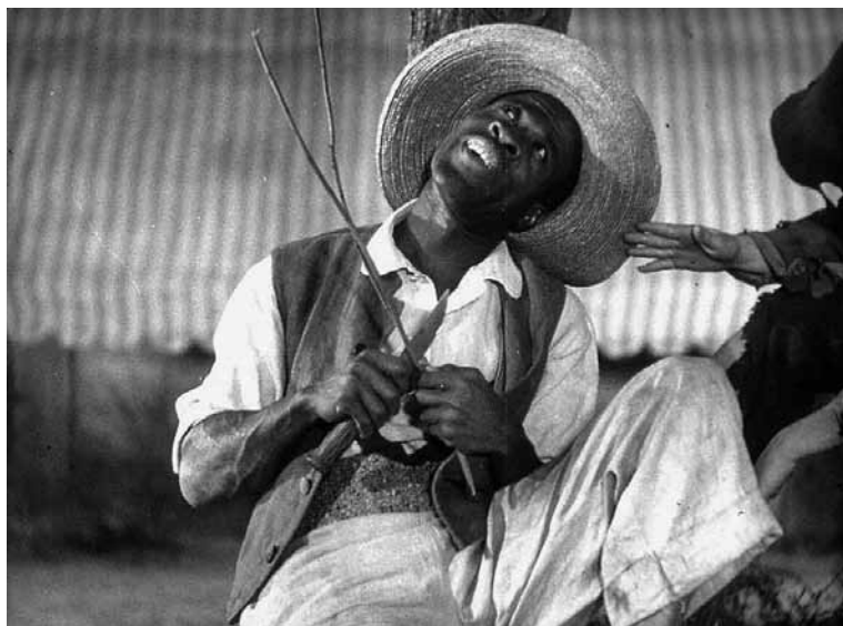
Том Сойер. 1936