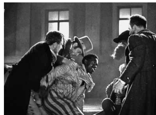
Таинственный остров. 1941