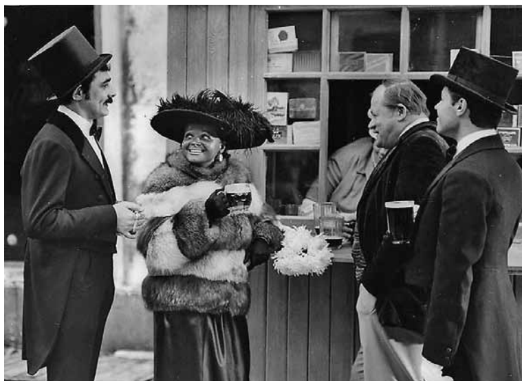
Мы из джаза. 1983. В роли негрятки — Лариса Долина