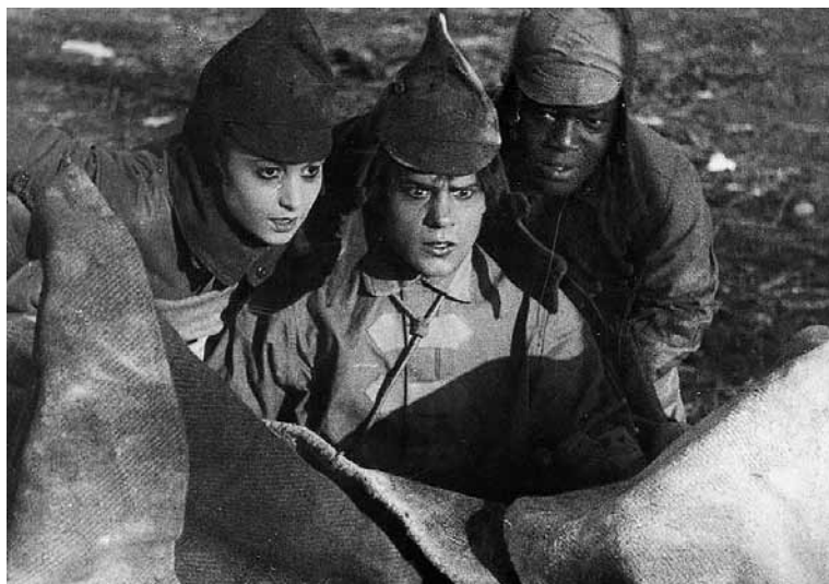
Красные дьяволята. 1923

Отдельная история у негров в советском кинематографе. На съемки вплоть до 1970-х годов приглашали настоящих негров.