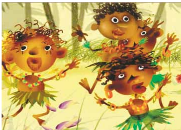
Похитители елок. 2005

Даже в наше время (2005) мы вновь наблюдаем негров, изображенных по неведомым стандартам.