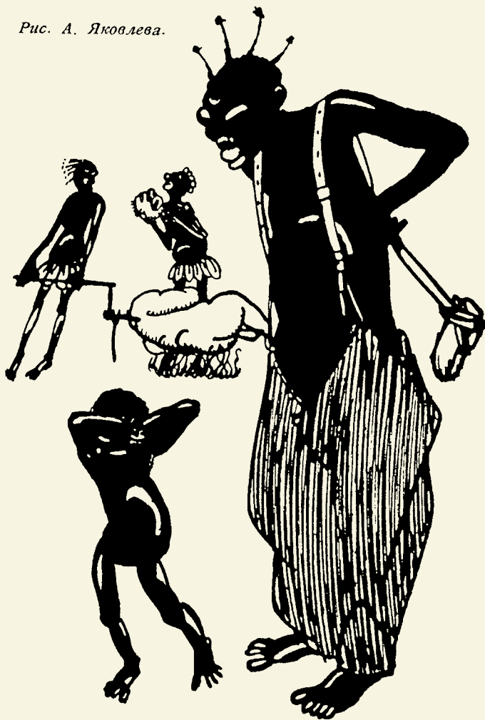
Рис. А. Яковлева.